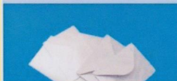
ENVELOPPES BLANCHES, PAPIERS DIVERS