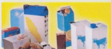
CARTONS ET BRIQUES ALIMENTAIRES