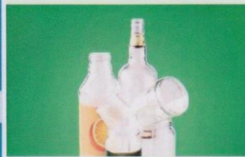
BOCAUX ET POTS EN VERRE

Des sacs de pré-tri et des guides pratiques sont disponibles en mairie