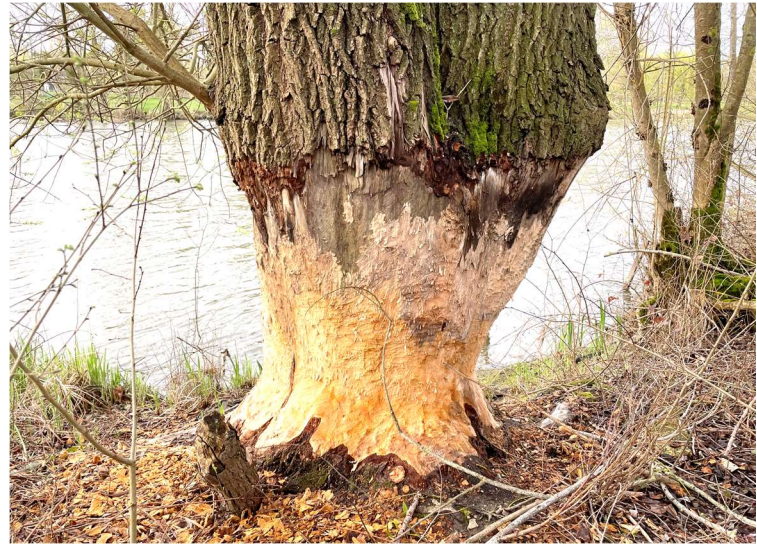
Les castors sont toujours présents à Chissay !