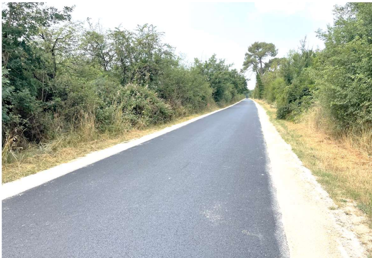
Début des travaux de la Vélo-route : du chemin de la Varenne à l'écluse