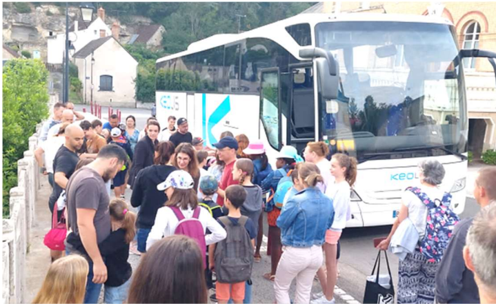
Départ de la classe des CM1- CM2 en classe de mer à la Tranche sur Mer