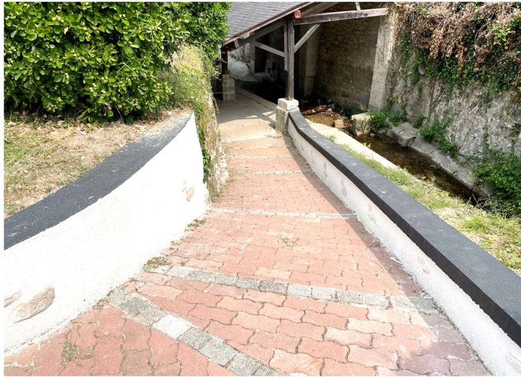
Aménagement des abords du lavoir du château