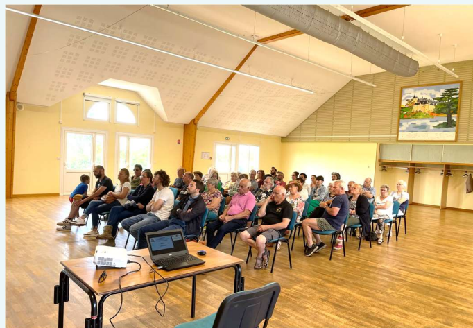
Les nouveaux habitants

Cette année encore, lors d'une cérémonie organisée par la municipalité, les diplômes des maisons fleuries ont été remis aux lauréats. Encore merci à tous ceux qui fleurissent leurs maisons de permettre ainsi d'égayer notre beau village. Ensuite, le maire accueillait les nouveaux habitants de Chissay en Touraine, leur présentant succinctement notre village, le conseil municipal, les employés communaux et l'ensemble des associations. Beau moment de convivialité qui s'est terminé par un vin d'honneur. Encore merci à toutes les personnes présentes.