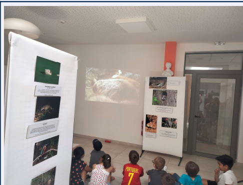
Accueil des scolaires