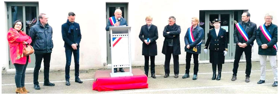
Inauguration des travaux de l'école et de la mise en place d'une chaudière biomasse