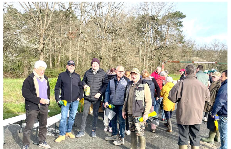
Journée propreté sur les bords du Cher