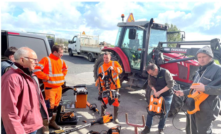
Essai de matériel par les services techniques