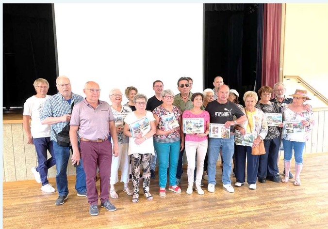
Les lauréats des maisons fleuries