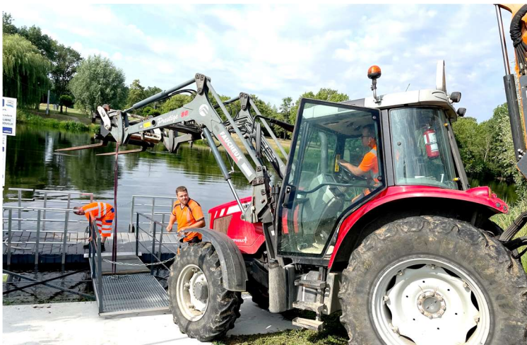
Remise en place du ponton pour accueillir la barge