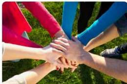
Chemin de mémoire - Ligne de démarcation Loire-Cher onparticipe.fr

Mise en place d'un chemin de mémoire de part et d'autre de la ligne de démarcation, le long du Cher Canalisé, de Chissay/St Georges à Noyers/Saint Aignan. Les 3 objectifs principaux du projet sont : conserver la mémoire historique, rendre hommage aux passeurs et aux victimes de la répression sur la ligne de démarcation, valoriser notre portion de Vallée du Cher.